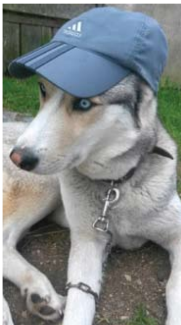
O čia Oksanos išdykėlis.